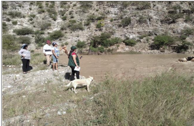
Fotografía Nº 02: Canal Perlamayo en el Tramo 7+000 – 7+140 con los derrumbes de la ladera saturada por las intensas lluvias y las filtraciones